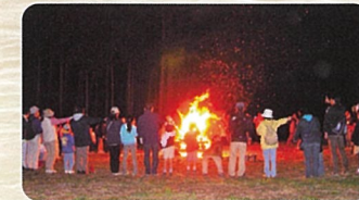
キャンプファイヤー