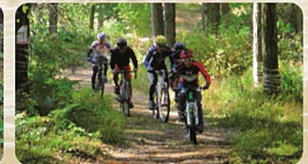
マウンテンバイク