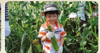
トウモロコシ狩り