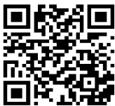
教室申込フォーム

WEBからのお申込みは手続きカンタン！ 利用者登録(無料)を行い、参加したい教室へ その場でいつでもカンタンに申込ができます！ 当選メールが届いたらネットお支払いも可能です！