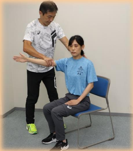
関節の動きの評価