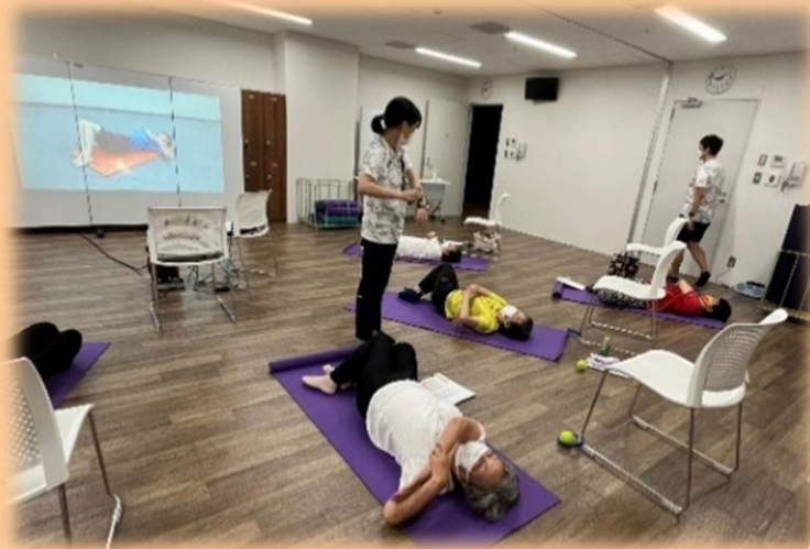
運動プログラムの実施