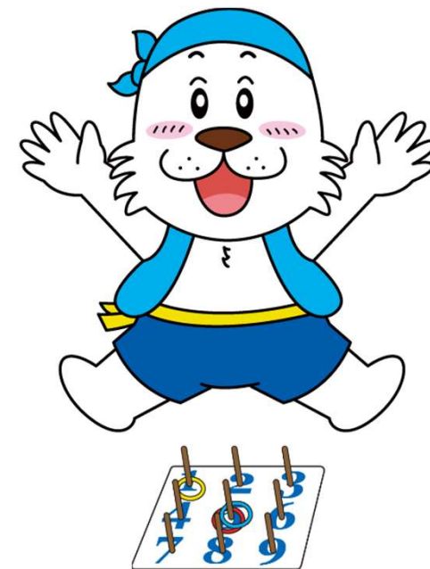
キャプテンわん(C)ゆず華・(公財)横浜市スポーツ協会