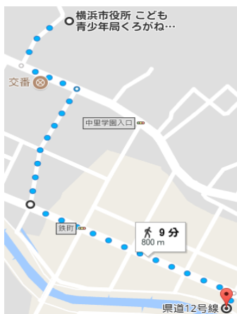
鶴見川（谷本川）までの行き方