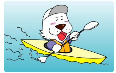
キャプテンわん (C)ゆず華・(公財)横浜市体育協会