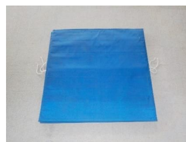
ウレタンマット(無料)