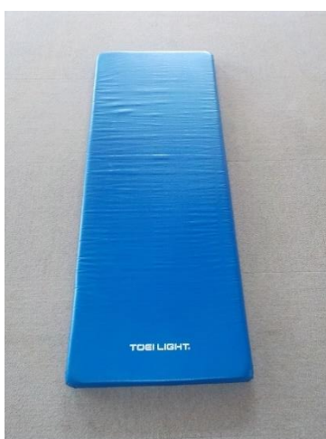
ストレッチマット 50円