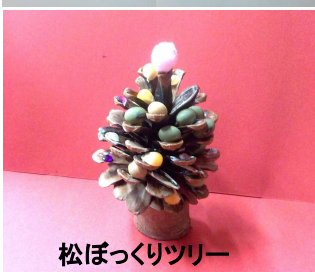
松ぼっくりツリー