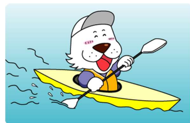
キャプテンわん (C)ゆず華・(公財)横浜市体育協会