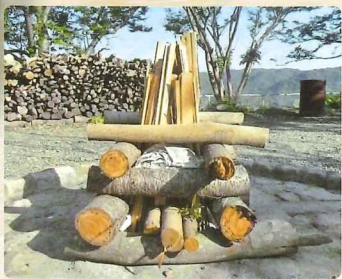
▲ キャンプファイヤー場