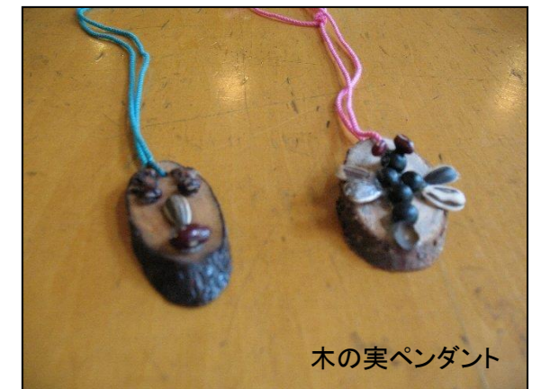
木の实ペンダント