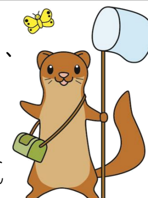
栄区 いたち川マスコット タッチーくん