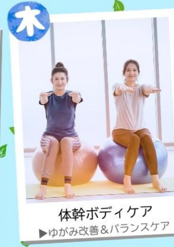
体幹ボディケア ▶ゆがみ改善&バランスケア