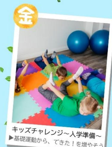
キッズチャレンジ~入学準備~ ▶基礎運動から、できた!を増やそう