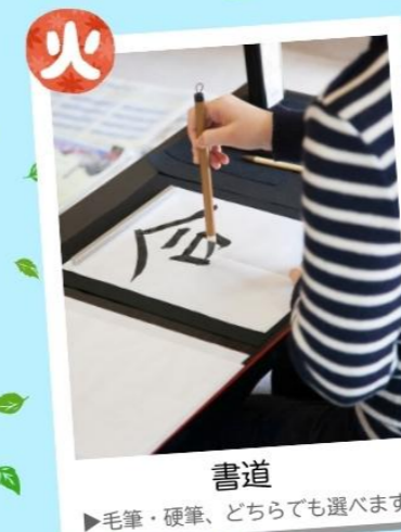
書道 ▶毛筆・硬筆、どちらも選べます