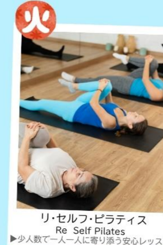
リ・セルフ・ピラティス Re Self Pilates ▶少人数で一人一人に寄り添う安心レッスン